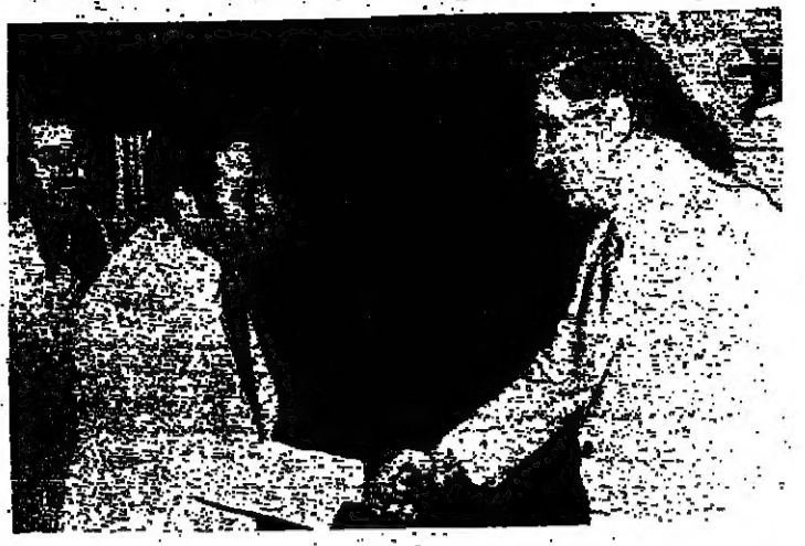
الرئيس سركيس يستقبل المبعوث الشخصي للشيخ زايد بن سلطان آل نهيان

٨ ملايين دولار مساعدة من دولة الامارات استقبل الرئيس سركيس المبعوث الشخصي للشيخ زايد بن سلطان آل نهيان في مقر الرئاسة في بيروت. وقد تم توقيع اتفاقية لمساعدة دولة الامارات العربية المتحدة للشيخ زايد بن سلطان آل نهيان بمبلغ ٨ ملايين دولار. وتضمنت الاتفاقية توفير امدادات طبية وصيدلانية وادوية. وقد تم توقيع الاتفاقية بحضور الرئيس سركيس ووزير الخارجية سركيس والمبعوث الشخصي للشيخ زايد بن سلطان آل نهيان. وكان مبعوث الامارات قد قدم عرضاً مفصلاً عن طبيعة المساعدة.